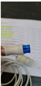
ITEM 78 - CONEXÃO OXIMETRIA WL 80.jpeg 47K