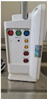
ITEM 76 - 79 - PAINEL DE CONEXÕES MINDRAY.jpeg 72K