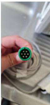
ITEM 75 - SENSOR OXIMETRIA BIONET BM3.jpeg 51K