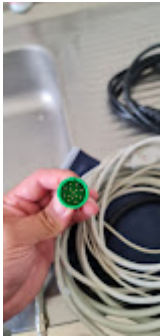
ITEM 69 - CONEXÃO ECG WORD LIFE WL 80.jpeg 66K