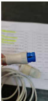
ITEM 78 - CONEXÃO OXIMETRIA WL 80.jpeg 47K