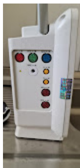
ITEM 76 - 79 - PAINEL DE CONEXÕES MINDRAY.jpeg 72K