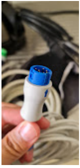
ITEM 78 -SENSOR OXIMETRIA WORD LIFE WL 80.jpeg 64K