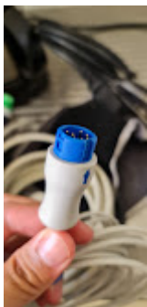
ITEM 78 -SENSOR OXIMETRIA WORD LIFE WL 80.jpeg 64K

Nova Friburgo Prefeitura <pregaoeletronico.friburgo@gmail.com> Para: licitacao@mastermedical.net.br