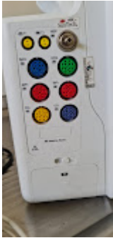
ITEM 69 - 78 - 80 - PAINEL DE CONEXÕES WORD LIFE WL 80.jpeg 79K