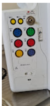
ITEM 69 - 78 - 80 - PAINEL DE CONEXÕES WORD LIFE WL 80.jpeg 79K